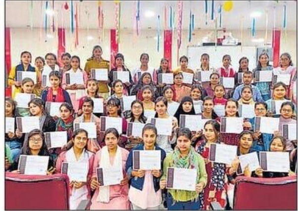
एमएम महिला कॉलेज में प्रमाण पत्र के साथ छात्राएं।