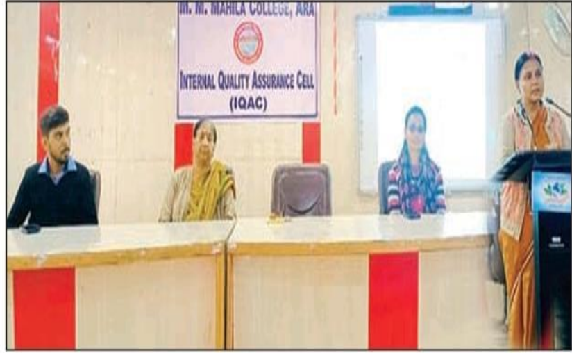
प्रशिक्षण कार्यक्रम में ट्रेनर।

आरा (एसएनबी)। महंत महादेवानन्द महिला महाविद्यालय में आईक्यूएसी और टीसीएस के संयुक्त प्रयास से नॉन-टेक्निकल ग्रेजुएट्स के लिए 90 घंटे का ट्रेनिंग प्रोग्राम शुरू हो रहा है, जिसका आज उद्घाटन हुआ। यह प्रोग्राम 22 दिन की ट्रेनिंग के साथ 11